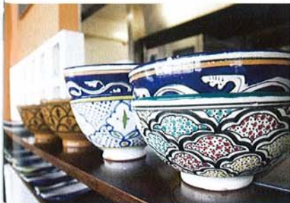
餐廳內所用的餐具皆很有中東特色