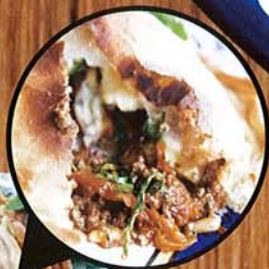
Spicy lamb mince, pinenuts, rocked, haloumi semi dried tomatoes $19.00 羊肉微辣，麵包外皮有點厚