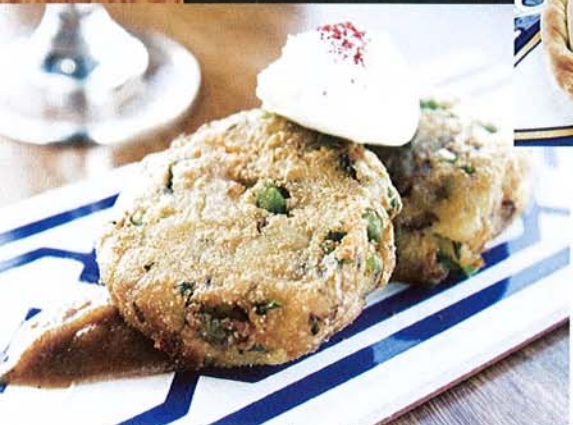
Moroccan potato cakes with cumin and coriander $7.50 炸薯餅配yogurt。