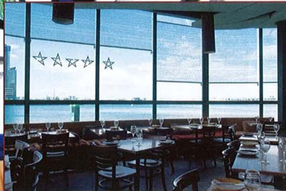
一邊欣賞無敵大海景一邊嘆中東菜