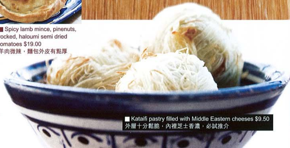
Kataifi pastry filled with Middle Eastern cheeses $9.50 外層十分鬆脆，內裡芝士香濃，必試推介